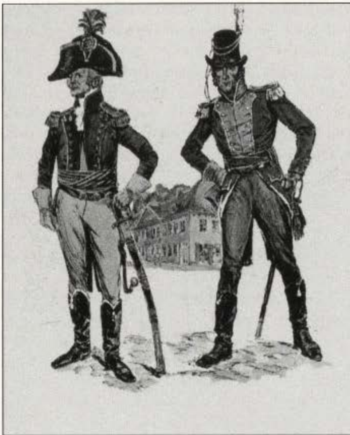
Det budde fleire offiserar i Hjelmeland på 1700- og 1800-talet. Offisersuniformer frå 1808. Borgarbevæpning til venstre, infanterioffiser til høgre.