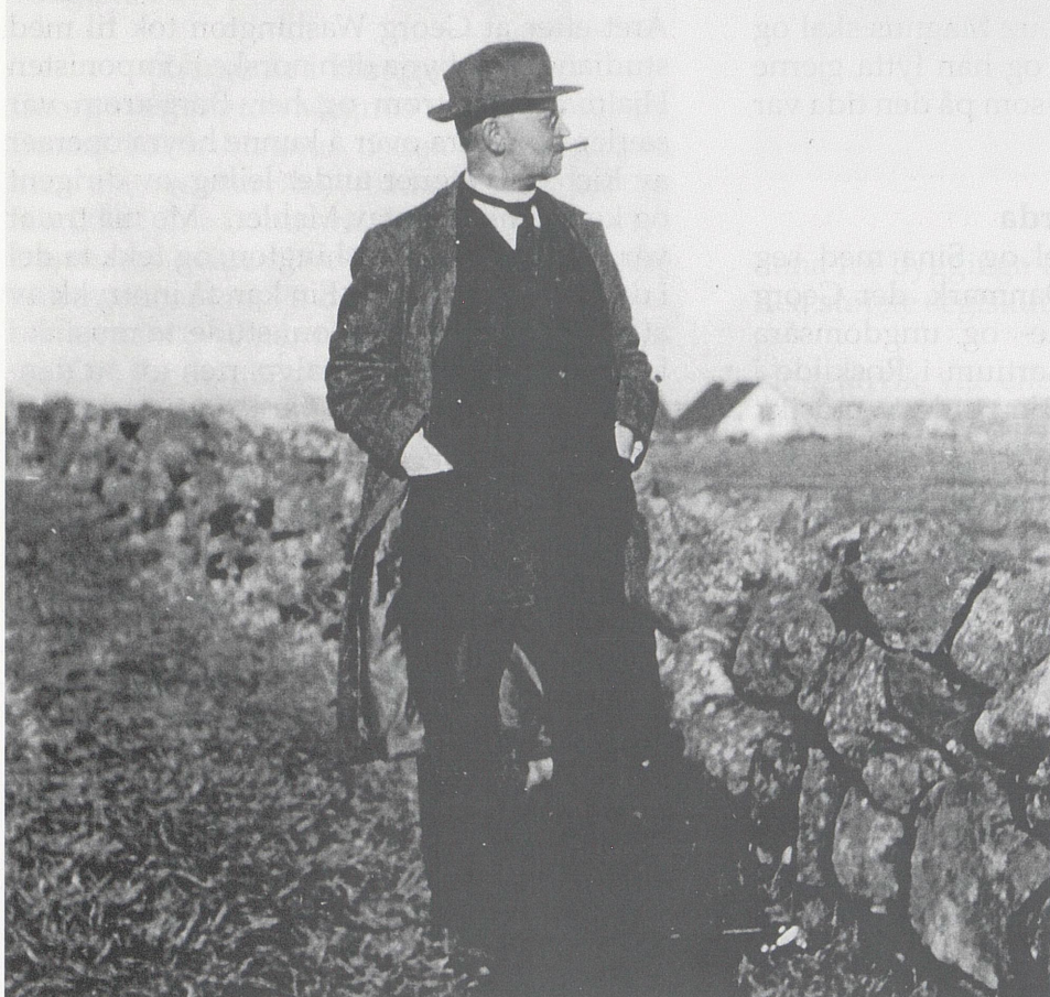
Komponisten som aldrande mann, truleg teke etter at han kom til Stavanger