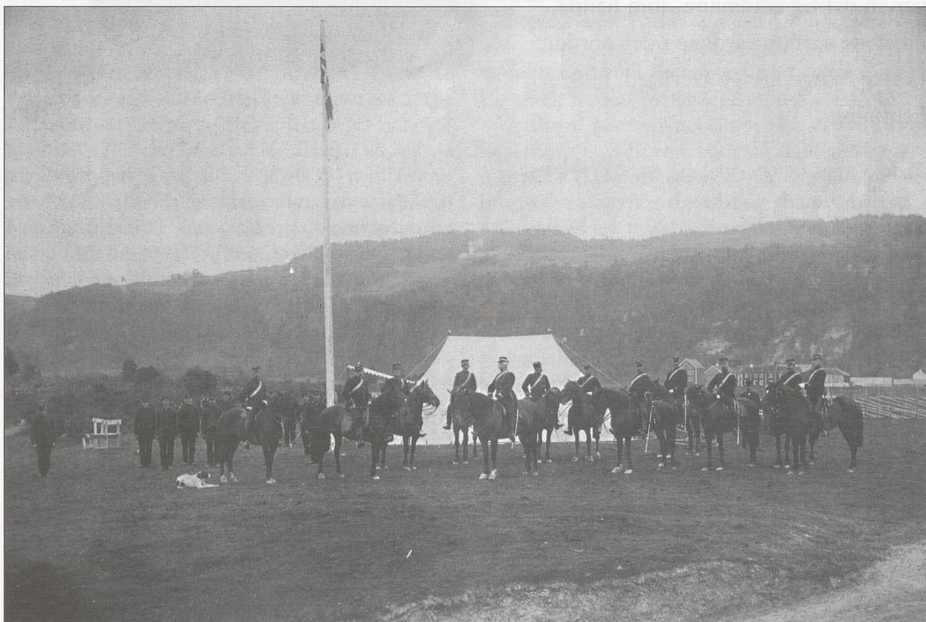
Dragoner på Øysand.