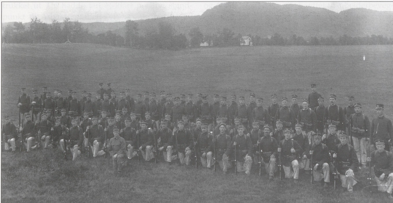
Et kompani på Øysand mot slutten av 1800-tallet.

godt, af godt Begrep, kand blive til meer beqvem."