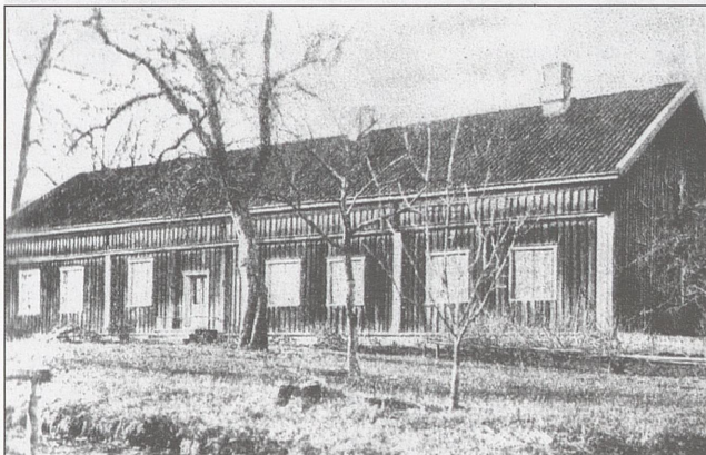
General von Kroghs hovedbygning på Mork, slik den ennå står. Huset ble oppført i 1731.

Opp gjennom middelalderen vet en vel mindre om den militære aktiviteten på Øysand. Først på 1600 tallet fikk en et mer organisert militærvesen oppdelt i egne avdelinger for de ulike våpengrenser. Flere slike avdelinger la sine sommerøvelser til ekserplassen på Øysand. Fra 1840 hadde Feltartilleriregiment nr 3 kontrakt på leie av ekser-